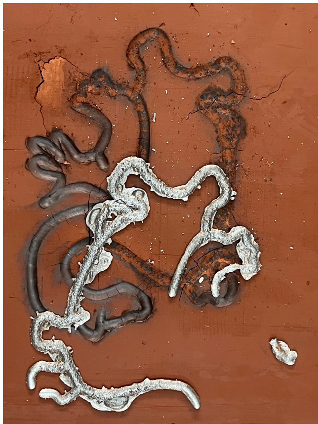
Fotografía del proceso de producción de las esculturas de la serie El tema de los dos caballos

2) En el subtítulo de la portada de una compilación de sus artículos –anteriores todos a los de las manos gesticulando– el autor anuncia, de manera innecesaria y por lo tanto sintomática, que el texto se acompaña de 366 dessins de l'auteur d'après les originaux . Uno casi querría traducir 366 dibujos de la mano del autor. El aviso parece querer dotar de valor al trazo personal del autor, lo que sorprende al comprobar que ninguno de esos dibujos manifiesta pretensión artística ni particular habilidad. Son esquemáticos apuntes que recogen elementos visuales que el antropólogo compara, mostrando la evolución formal de varios motivos, en series o temas. En estas series, el referente figural de origen se va perdiendo y abstrayendo en ornamentos relacionables a través de distintas culturas, usos y épocas.